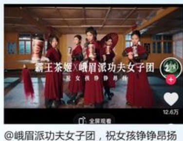
@峨眉派功夫女子团，祝女孩铮铮昂扬