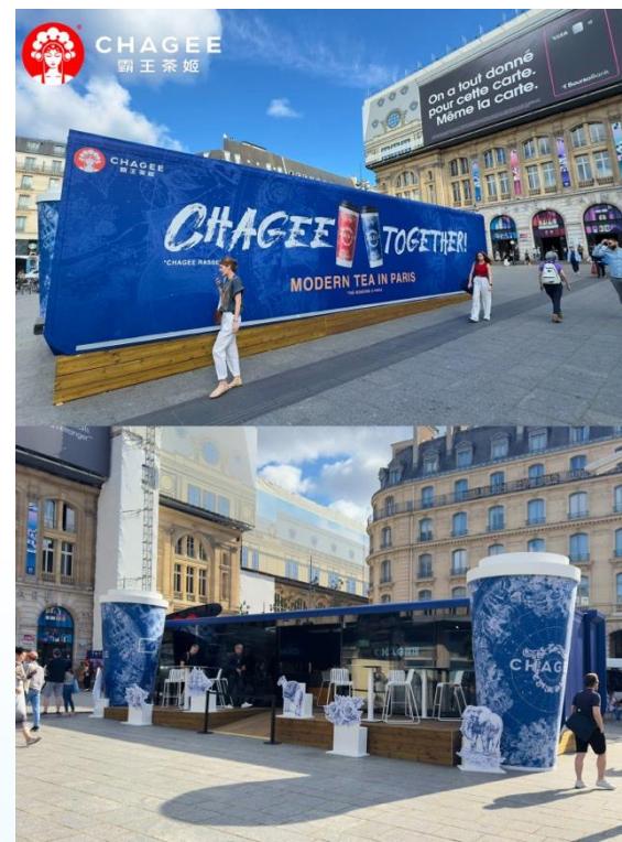
打造“霸王茶姬霸王出征”任务延展至职场出征、朋友出征等场景