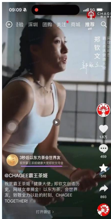
霸王茶姬“健康大使”郑钦文摘金庆贺视频