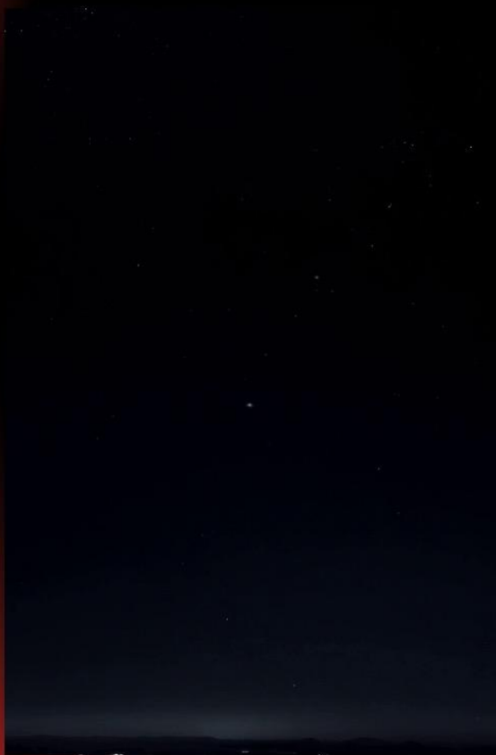
极 夜 黑