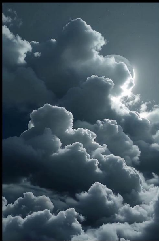
弦 月 灰