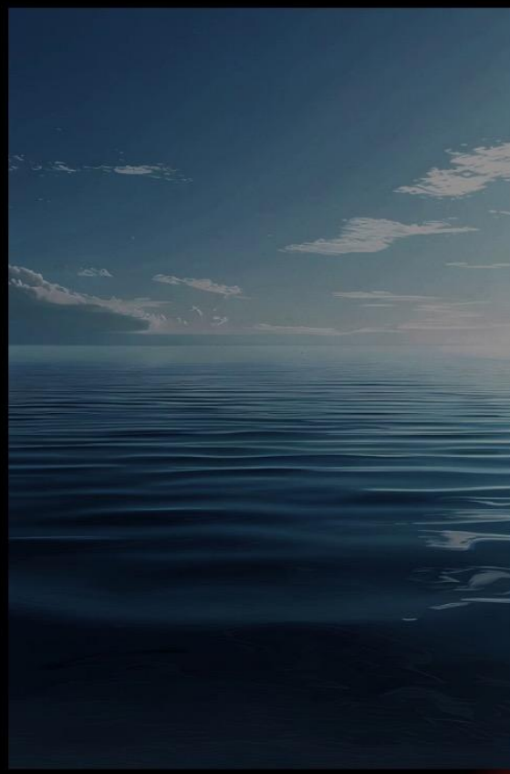
静 海 蓝