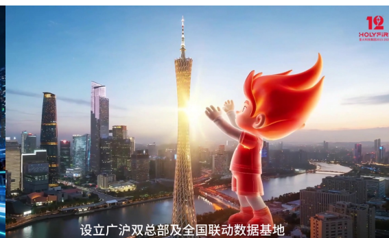
设立广沪双总部及全国联动数据基地