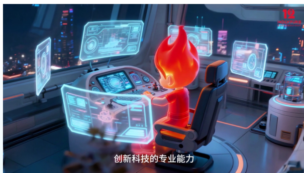
创新科技的专业能力