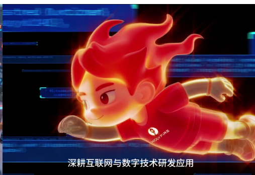
深耕互联网与数字技术研发应用