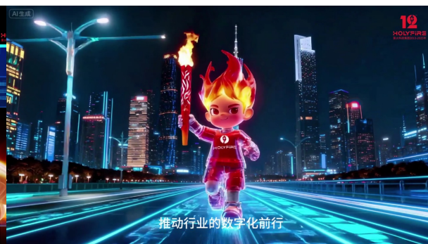
推动行业的数字化前行