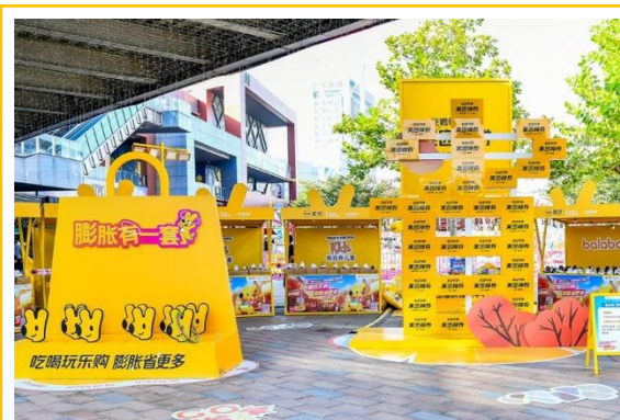
神券4.0 十一中秋双节庆