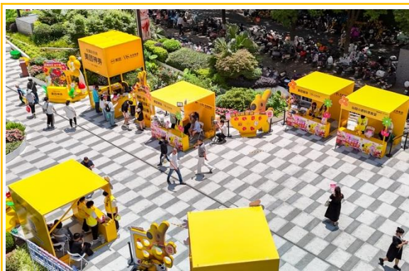
神券1.0 武汉五一黄金周