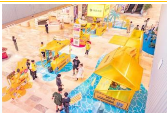
神券3.0 全国夏日神券派对