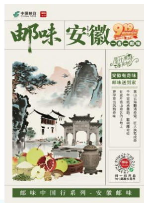
邮味中国行系列-安徽邮味