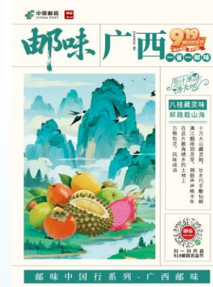
邮味中国行系列-广西邮味