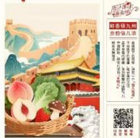
邮味中国行系列-北京邮味