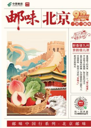
邮味中国行系列-北京邮味