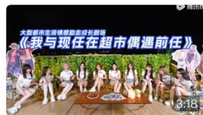
「闪耀48」国王游戏:我与现在在超市偶遇前任 UP 九可摘笪晨 1.8万 · 2024年7月23日