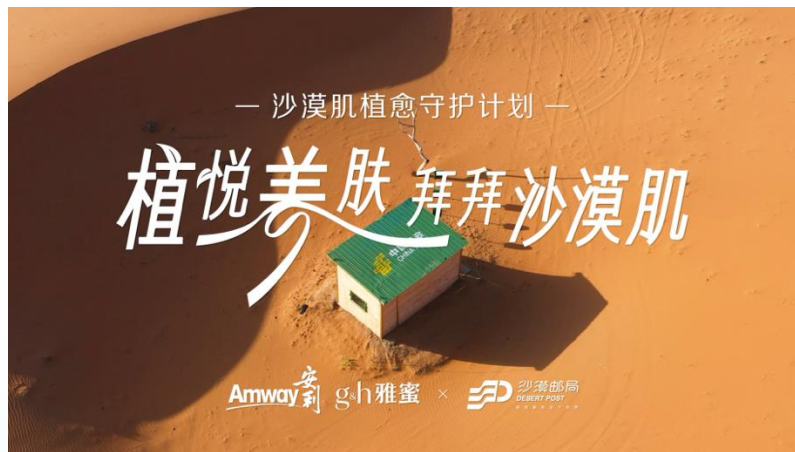
安利雅蜜×沙漠邮局 沙漠绿色公益营销TVC