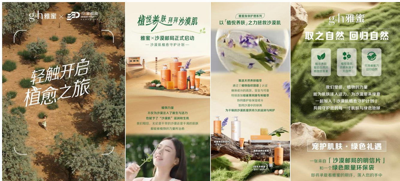
《安利雅蜜x沙漠邮局 | 邀您开启植愈之旅》跨界合作官宣推文内容节选