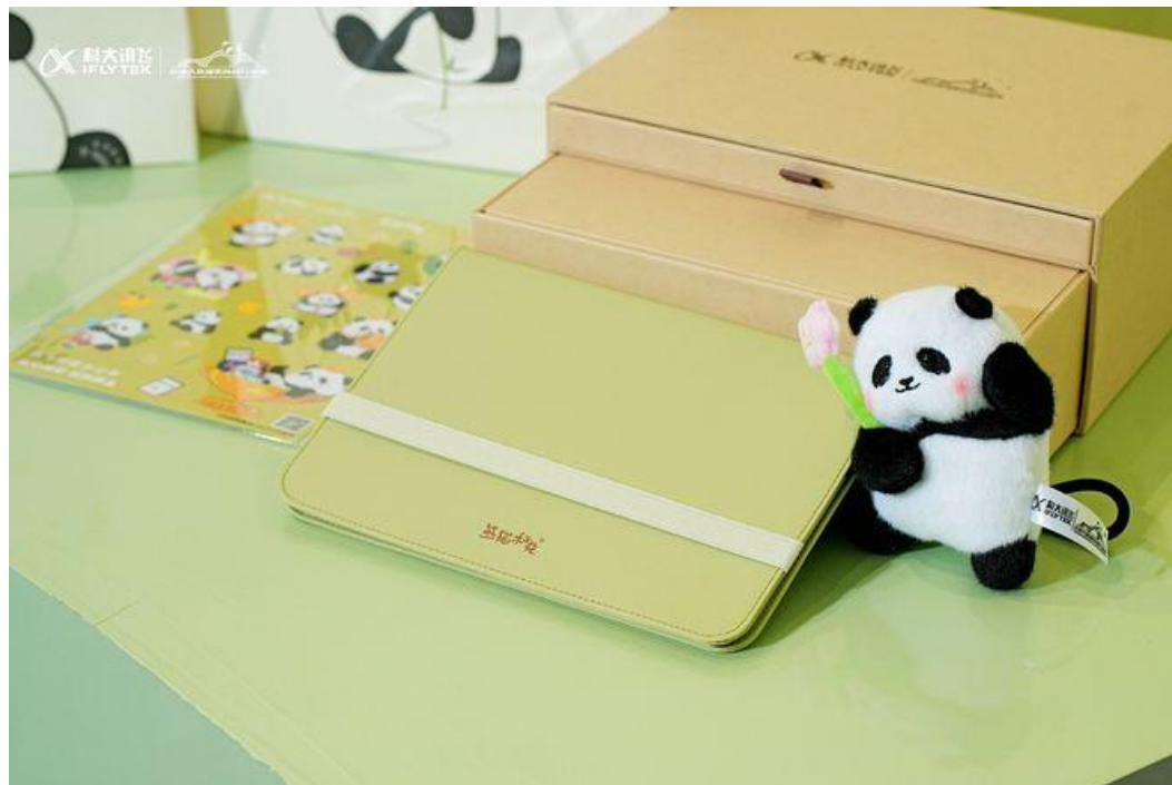
讯飞智能办公本 Air2 熊猫和花联名款 礼盒设计