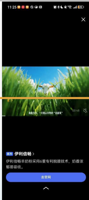
AIGC大片全景呈现 7486公里溯源之旅