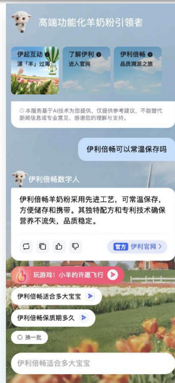
智能答疑直联官网 即时解惑深化信任