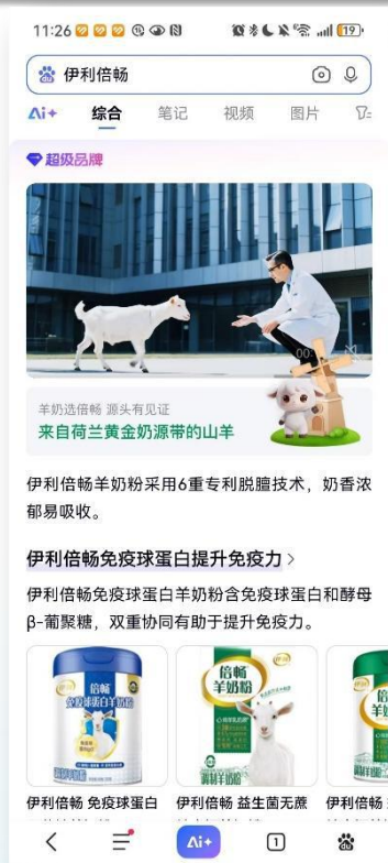
一站式获取品牌信息 建立初步认知