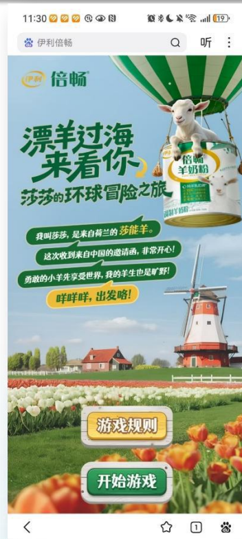
互动游戏助力飞行 趣味解锁溯源知识