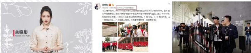
名人效应引爆粉丝群体关注