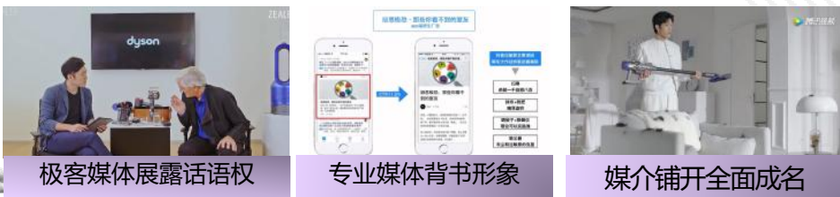
极客媒体展露话语权