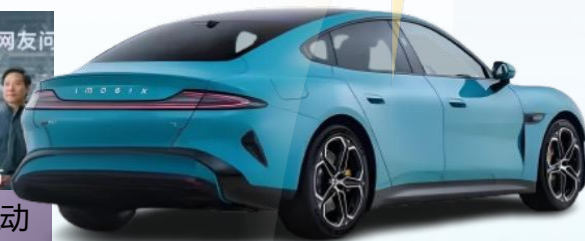
雷军自带流量调动消费者互动