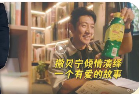
撒贝宁倾情演绎一个有爱的故事

通过撒贝宁温情故事短片+“科普+带货”课堂式创新直播,最大化地触达更多人群,增强海天品牌力。