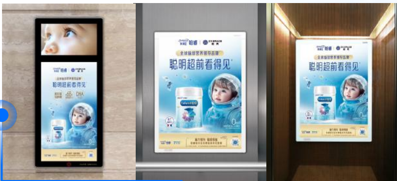
社区/商区梯媒投放