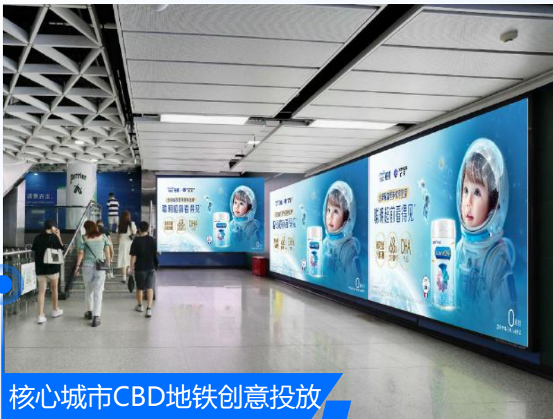
核心城市CBD地铁创意投放