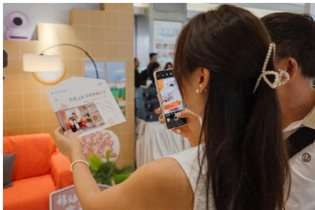
表 爱 意