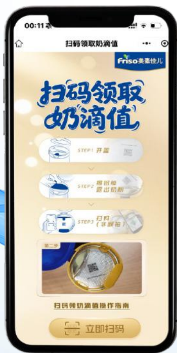
一键扫码实时激活