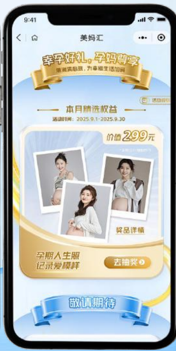
全渠道全周期礼赠回馈