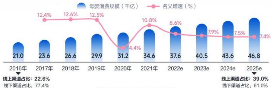
中国母婴市场消费规模

尽管生育意愿有待提升，但凸显的消费韧性带动母婴市场逐渐回暖；同时，移动互联网高速发展改变母婴人群的消费习惯，线上消费规模扩大