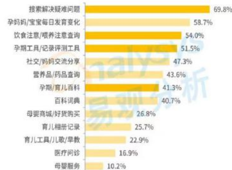
使用母垂平台时，主要涉及的需求

数据说明: 本结论仅为本次调研结果的描述, 数据来源于2023年9月易观分析关于中国新母婴人群孕育旅程学习与消费相关问题调研的问卷, N=2500