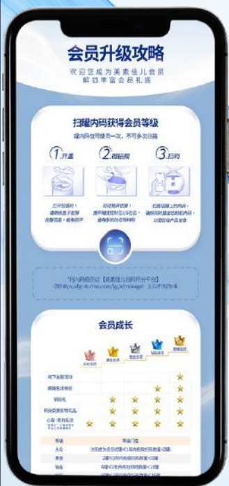
多元化成长型会员权益体系

强化“扫码”功能入口，一键扫码实时激活，培养用户扫码积罐习惯，提升会员权益等级与活跃度，构建构建了多元化成长型会员权益体系，覆盖全渠道全场景。