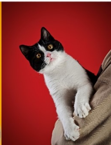
XIBOMI 15 Ultra 70mm f/1.8 1/1000s ISO640