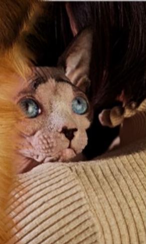
XIBOMI 15 Ultra 70mm f/1.8 1/800s ISO250