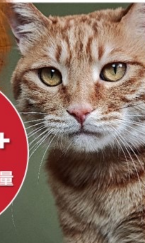
XIBOMI 15 Ultra 70mm f/1.8 1/500s ISO640