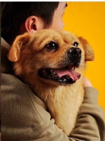
XIBOMI 15 Ultra 70mm f/1.8 1/400s ISO800