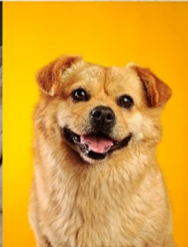
XIBOMI 15 Ultra 70mm f/1.8 1/400s ISO800