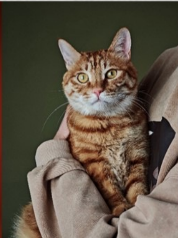
XIBOMI 15 Ultra 70mm f/1.8 1/500s ISO250