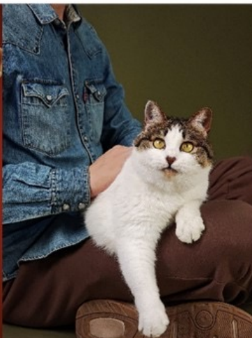
XIBOMI 15 Ultra 70mm f/1.8 1/640s ISO800