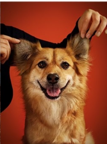
XIBOMI 15 Ultra 70mm f/1.8 1/640s ISO640