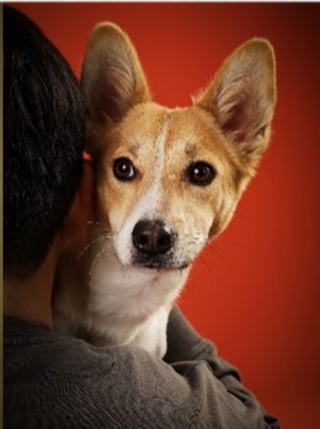
XIBOMI 15 Ultra 70mm f/1.8 1/640s ISO640