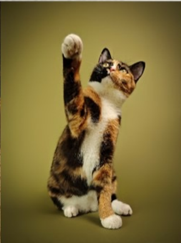
XIBOMI 15 Ultra 23mm f/1.63 1/400s ISO500