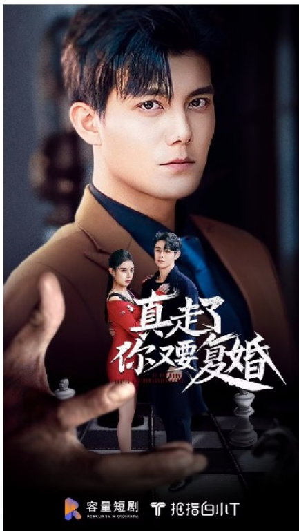
短剧《真走了你又要复婚》上线