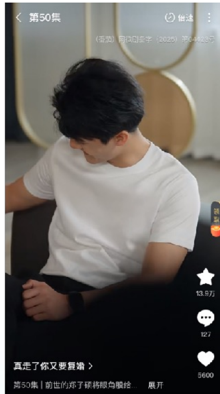
男主多次上身，直观呈现白小T产品卖点