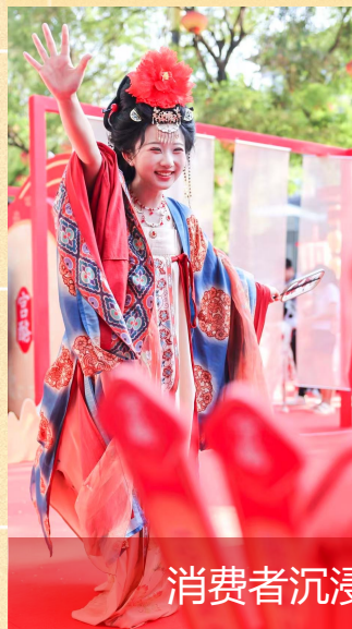
消费者沉浸式体验活动

区别于传统线下活动用户作为参与者角色 打造沉浸式“剧本杀”，消费者成为活动主导者 贯彻传播主题，将5000+消费者宠成贵妃