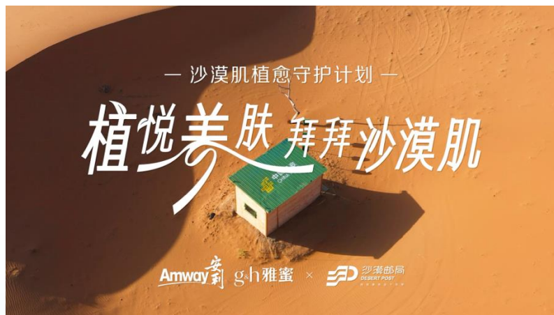
安利雅蜜×沙漠邮局 沙漠绿色公益营销TVC