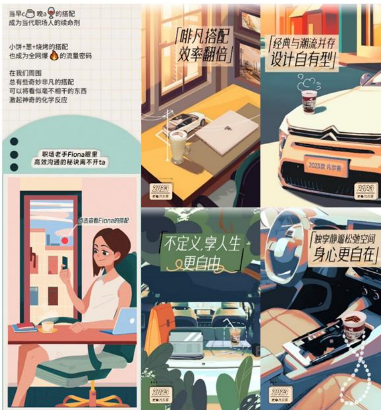
职场观察 趣味互动条漫 打工方式惬意升级