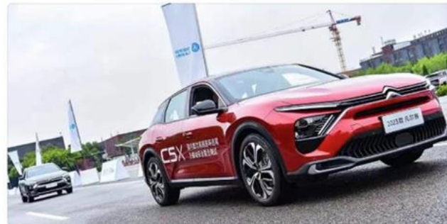
车圈科普 品牌对话&KOL测评 车型升级之处