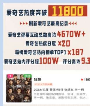
爱奇艺热度平台纪录