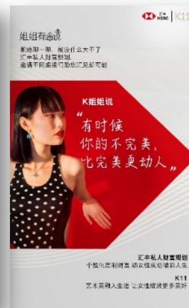
艺术家姐姐有话说 你的美谁定义？你自己！ ——K11