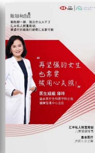
医生姐姐有话说 有健康，才能任性做自己！ ——嘉会医疗