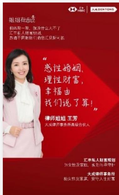
律师姐姐有话说 什么样的女孩，才是真正的独立女性？ ——大成律所

联合大成律所、《经济学人》杂志、嘉会医疗、K11购物中心四大品牌，从专业角度，分享如何更好规划人生财富。