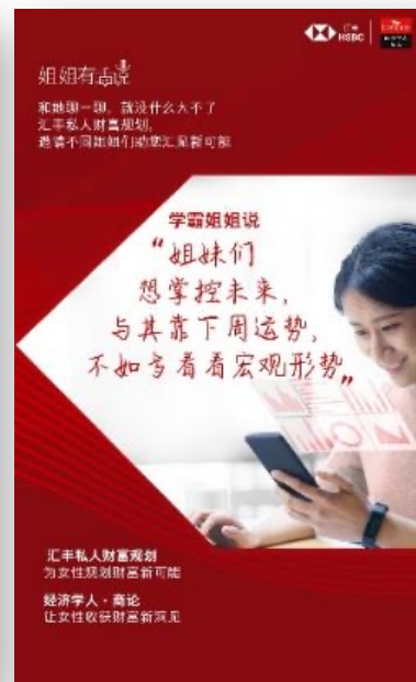
学霸姐姐有话说 对宏观形势侃侃而谈， 只能是男人吗？ ——经济学人·商论