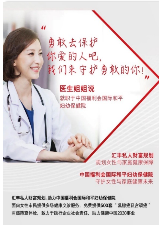
国际和平妇幼保健院