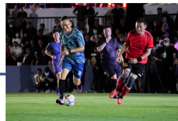
上市发布会，足球活动