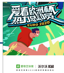
欧洲杯新媒体转播冠名