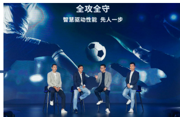
足球天团活动出席