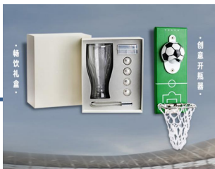
足球周边互动礼品