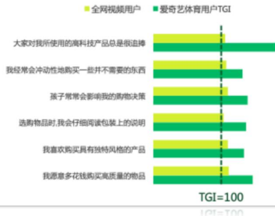
爱奇艺体育用户消费观偏好TGI