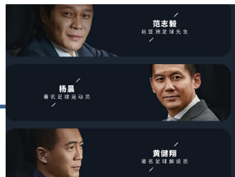
合作资源：足球天团