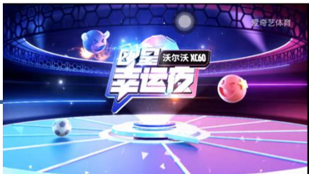
冠名欧洲杯综艺互动节目