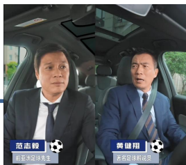
足球天团互怼 短视频预热