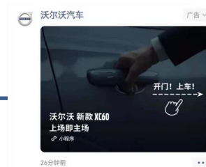
欧洲杯主题朋友圈广告