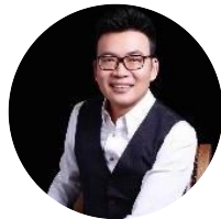
胡慎之 关系心理学家