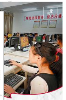
界比起点更重要 ICBC 中国工商银行