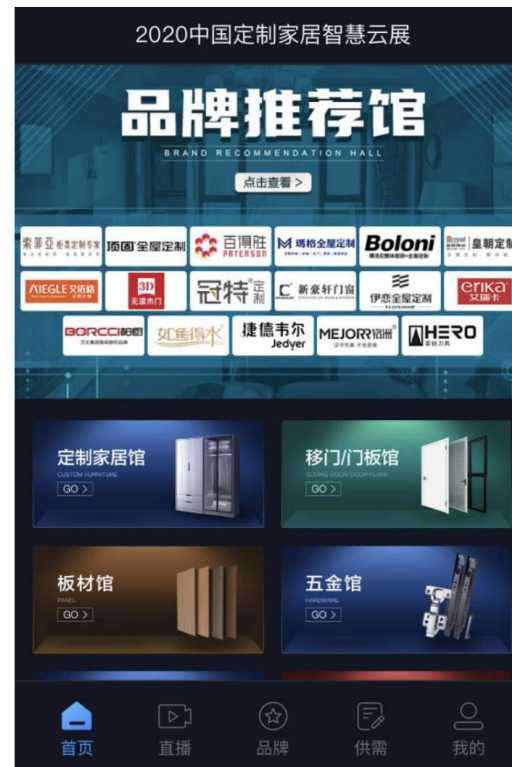
百度VR营销平台支持的“2020中国定制家居智慧云展”开屏页与首页