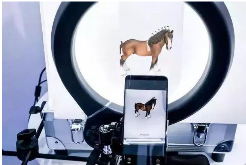
百度VR营销平台信息采集过程展示

百度VR营销平台主要背靠百度流量与技术，围绕全品类的VR内容（3D环物、全景、3D模型），适用于汽车、珠宝、快消品、家居、电商等多个行业营销场景。