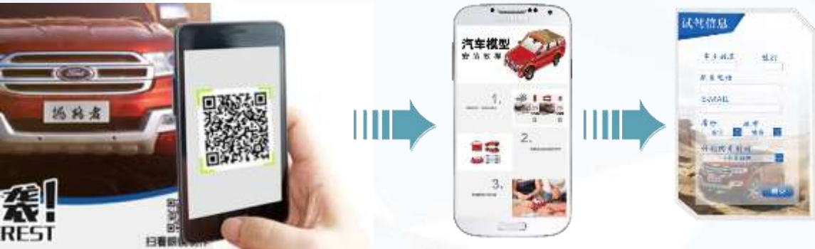
扫二维码可查看拼图教程，并可预约试驾