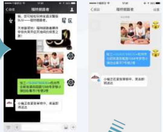
移动端一键上传，获得奖品