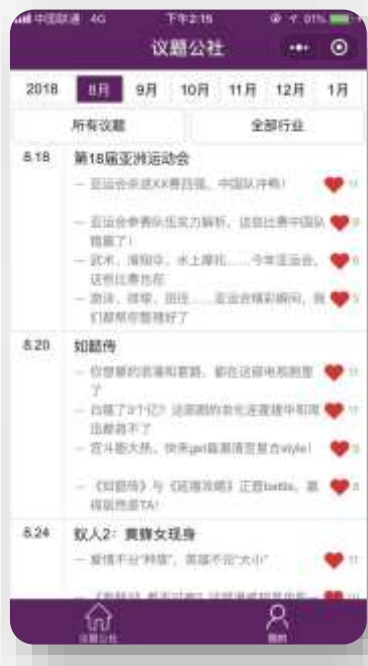
全年选题规划早知道