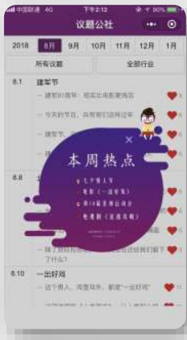
移动端小程序，沟通便利